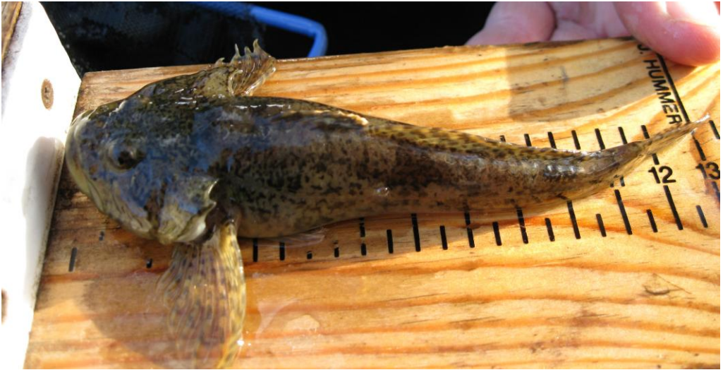
Abb. 1: Adulte Westgroppe (Poischower Mühlbach 2010)