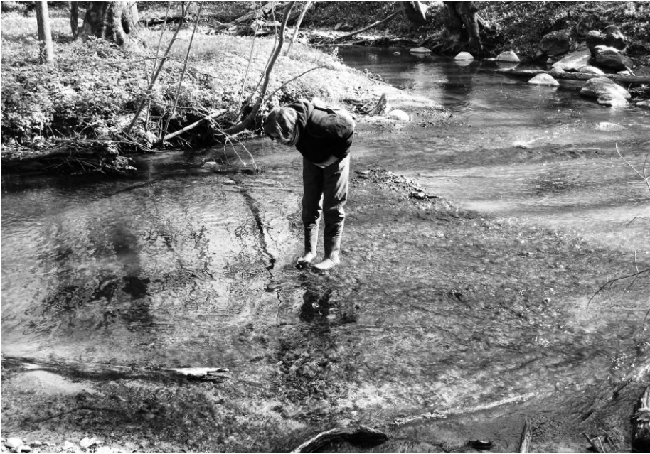
Abb. 1: Visuelle Zählung laichender Bachneunaugen in der Beke

Die mehr oder weniger zufällige Sammlung von Verbreitungsdaten der Neunaugen im Rahmen des durch den Landesfachausschuss Feldherpetologie und Ichthyofaunistik geführten Fischartenkatasters wurde 2003 um eine halbquantitative Verbreitungskartierung erweitert. Bei dieser werden Gewässer mit Nachweisen oder Vorkommensverdacht mit einer Standardmethode (Sedimentsiebung) systematisch auf Neunaugenlarven durchsucht. Ergänzend finden auch Elektrobefischungen statt. Sofern ein Vorkommen des Flussneunauges nicht auszuschließen ist (z. B. auf Grund von Wanderhindernissen), werden darüber hinaus visuelle Kontrollen potenzieller Laichhabitate im Frühjahr durchgeführt (Abb. 1).