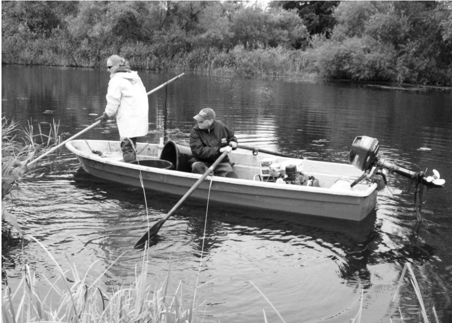
Abb. 4: Elektrofischung beim Bitterlingmonitoring in der Uecker

richtlinie konnten Erstnachweise (19), insbesondere beim Bitterling erbracht werden. Obwohl die Verbreitungsangaben zum Vorkommen der Arten im Bundesland dadurch erheblich verbessert wurden, gibt es regional noch immer bearbeitungsbedingte Lücken. Grundsätzlich zeichnet sich aber beim Steinbeißer ein nahezu flächendeckendes Auftreten ab. Beim Schlammpeitzger und beim Bitterling zeigen sich dagegen immer deutlicher Verbreitungslücken, die nicht auf Bearbeitungsmängel, sondern entweder auf das naturräumliche Fehlen entsprechender Habitats oder eine anders bedingte Abwesenheit der jeweiligen Art zurückzuführen sind.